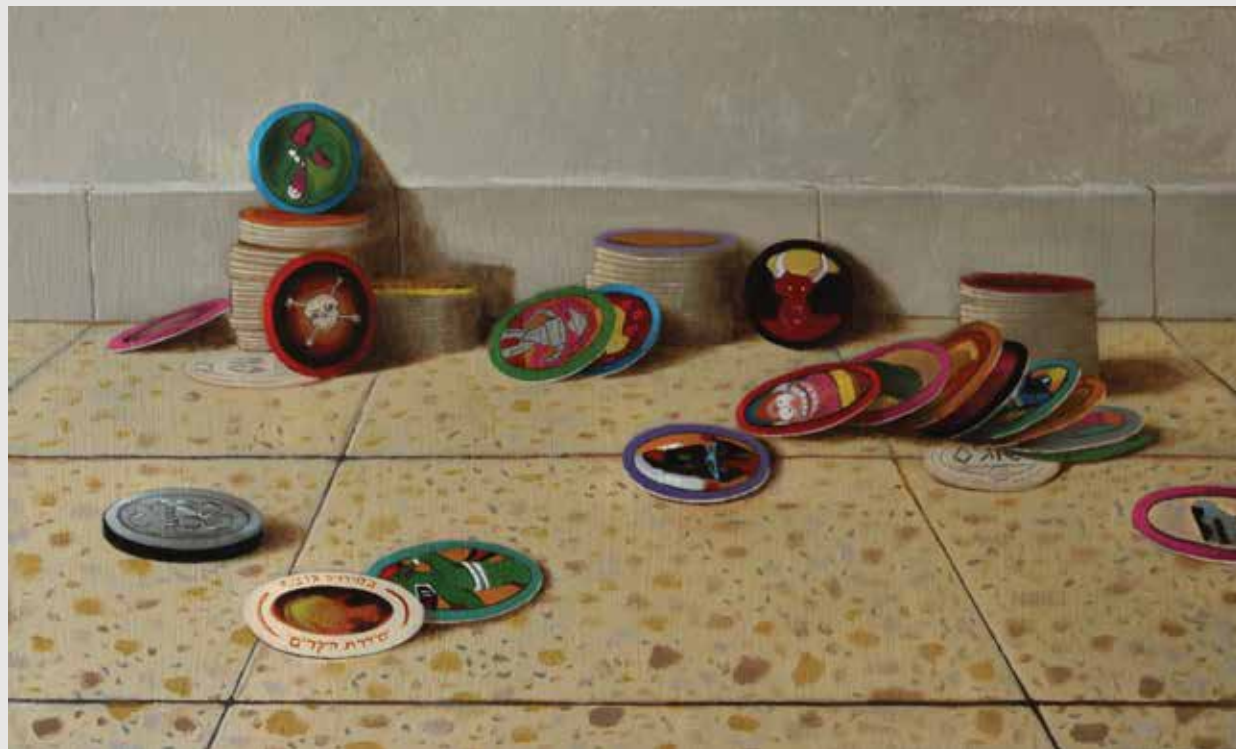
Pogs on the floor Oil on wood panel 50X30 cm