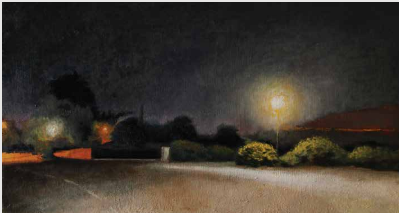
The parking lot at night Oil on wood panel 65X35 cm

מגרש החניה בלילה שמן על לוח עץ 65X35 ס"מ