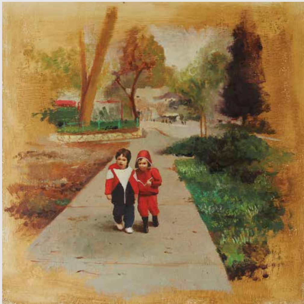
עמרי ואני | Omri & I 35X35 ס"מ שמן על עץ Oil on wood panel