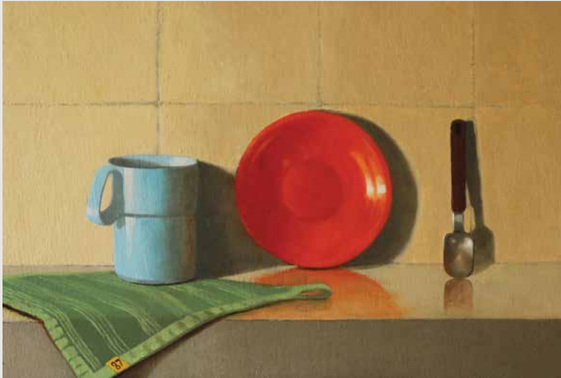
Dinnerware Oil on wood panel 44X30 cm