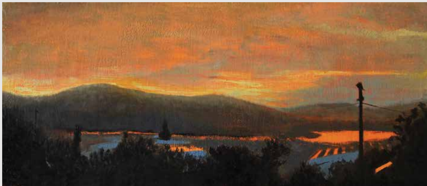
The Reservoir at sunset Oil on wood panel 40X17 cm