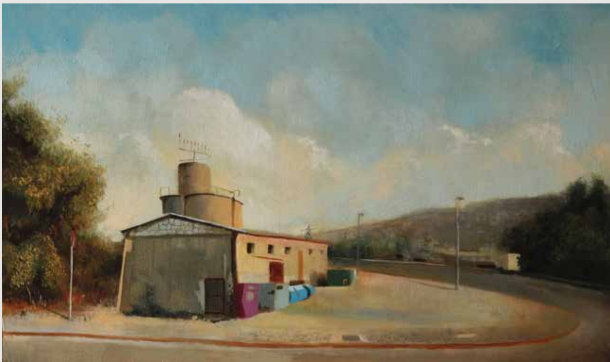
The Carpentry Oil on wood panel 50X29 cm