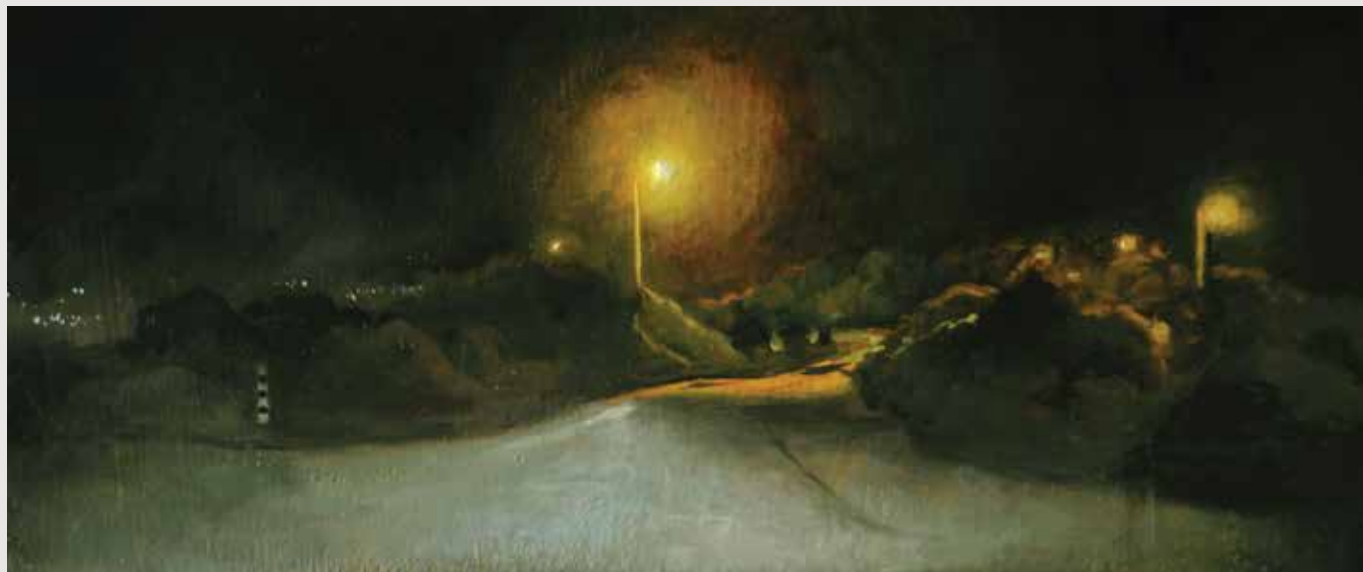
The Kibbutz exite at night Oil on wood panel 40X17 cm