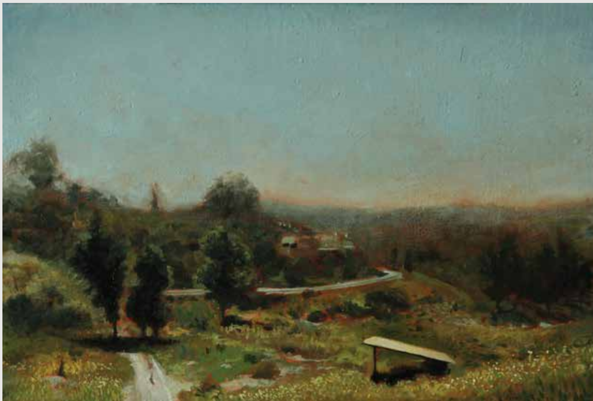
The Coral Oil on wood panel 30X20 cm