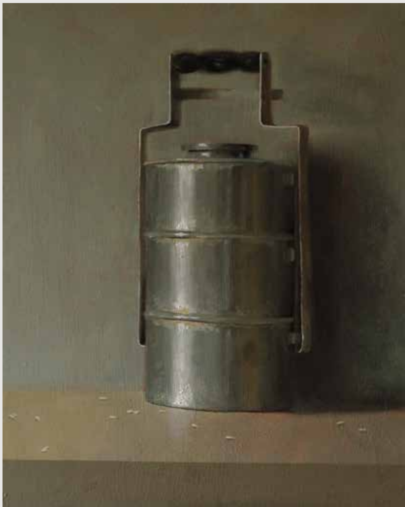
סיר המעלות | Seer Hamaalot 40X50 ס"מ שמן על לוח עץ Oil on wood panel