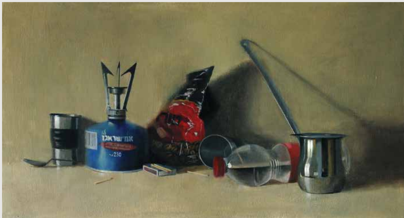
Pakal Kaffe (coffee kit) Oil on wood panel 65X35 cm