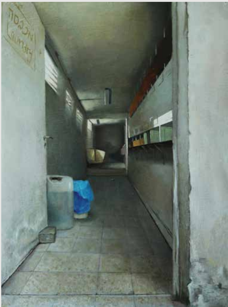
The Laundry | המכבסה 30 X 40 ס"מ שמן על לוח עץ Oil on wood panel