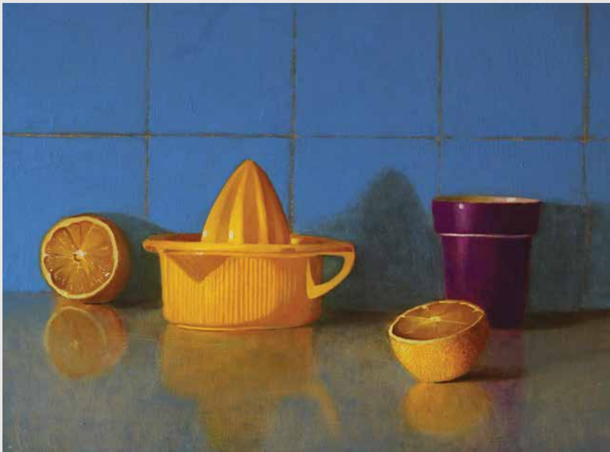
Orange squeezer, oranges & purple cup Oil on wood panel 42X31 cm