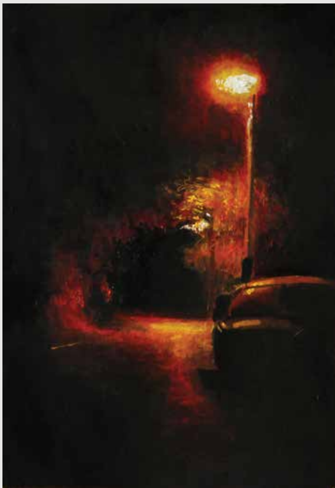
Night Light | תאורת לילה 11X16 ס"מ שמן על לוח עץ Oil on wood panel