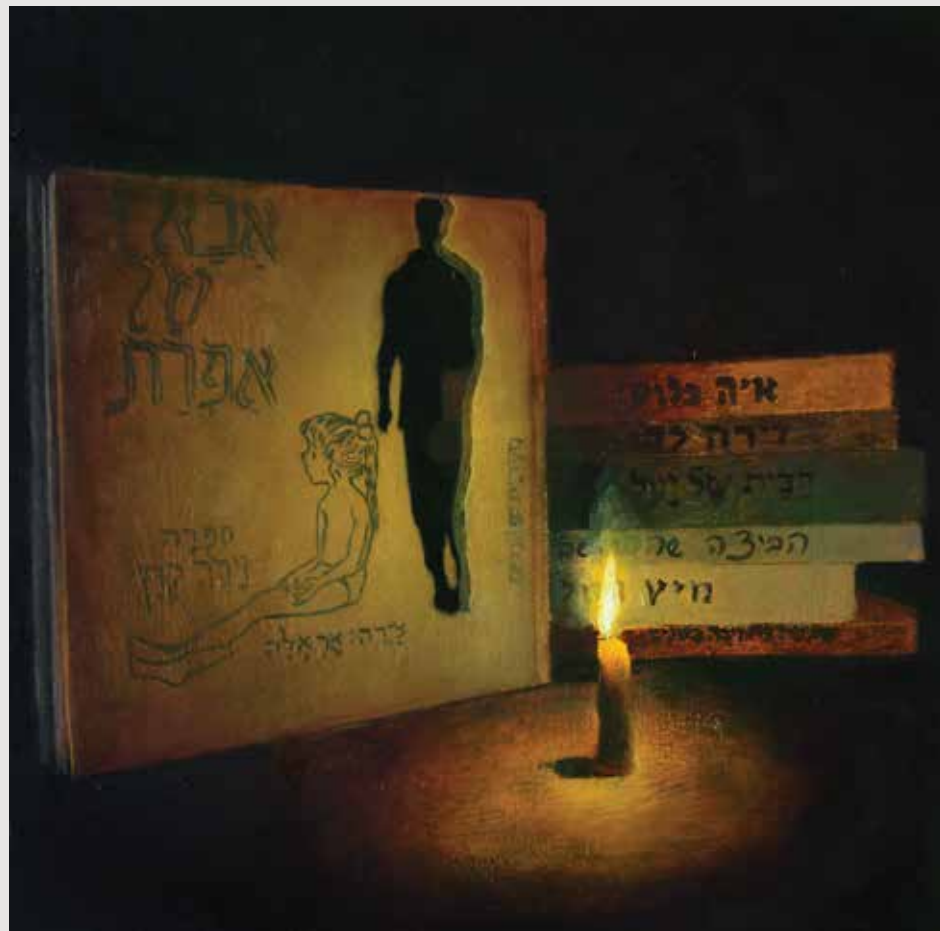
אימת החלל הריק Horror vacui 30 X 29 ס"מ שמן על לוח עץ Oil on wood panel